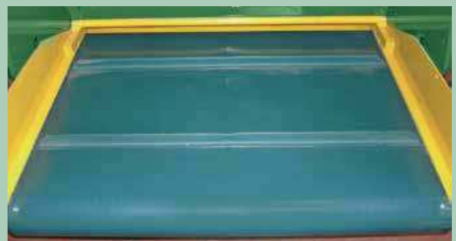
Als optie leverbaar met PVC-band.