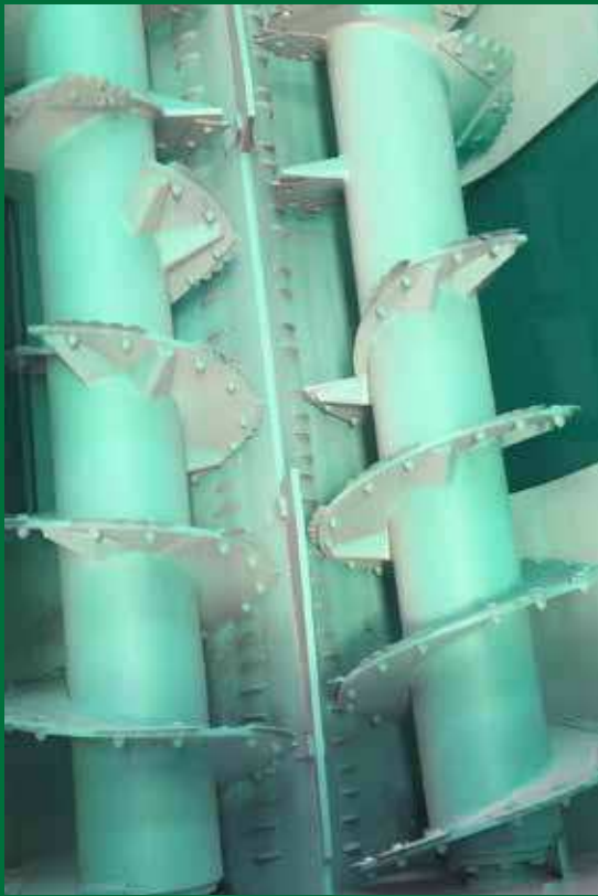
Twee horizontale vijzels zorgen voor een intensieve mening.