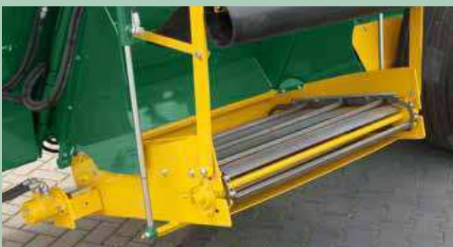
Als optie leverbaar met een onderhoudsvrije RVS ketting en bodemplaat.