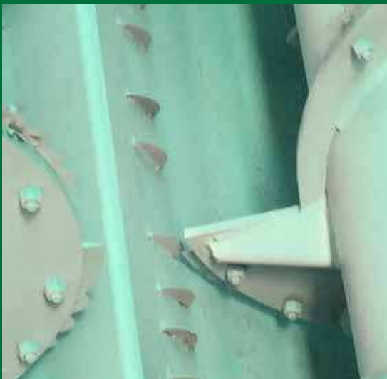
Extra messen op de bodem vergroten het snij-effect.