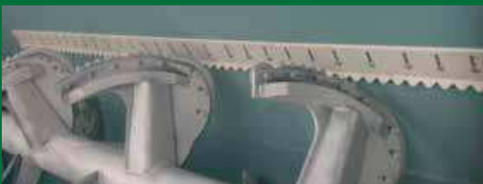
Optioneel leverbaar met tegenmes voor beter versnijding van stro, voederbieten en aardappels.