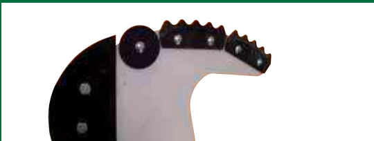
Roervleugel met asymmetrische vleugels. Leverbaar met of zonder messen.