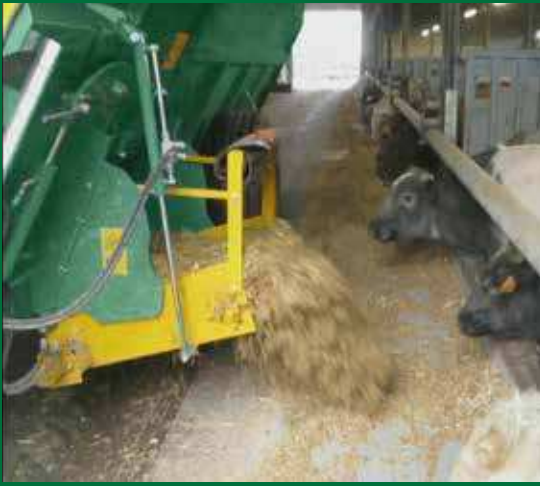
Dosering gelijkmatig en snel, lost ruim buiten de wielen.